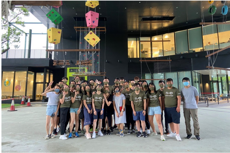
2021 Green to Goal RP camp