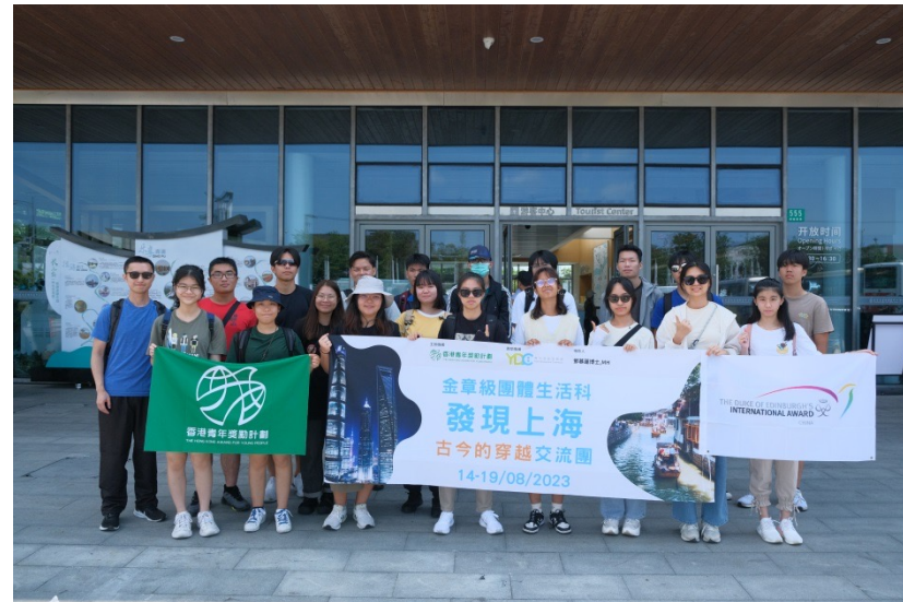
2023 Discover Shanghai