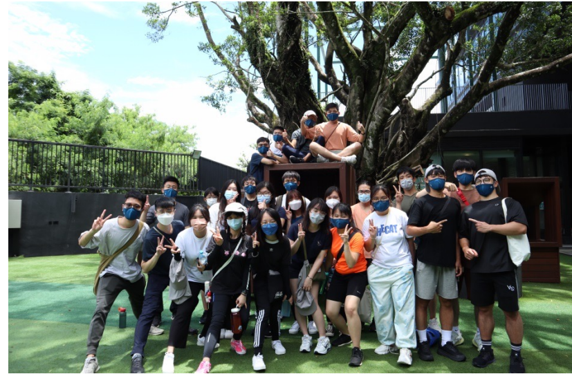
2022 Feel Your Heart RP camp