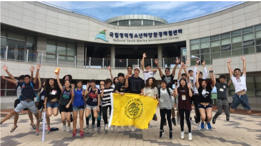
2017 Korea Exchange Project