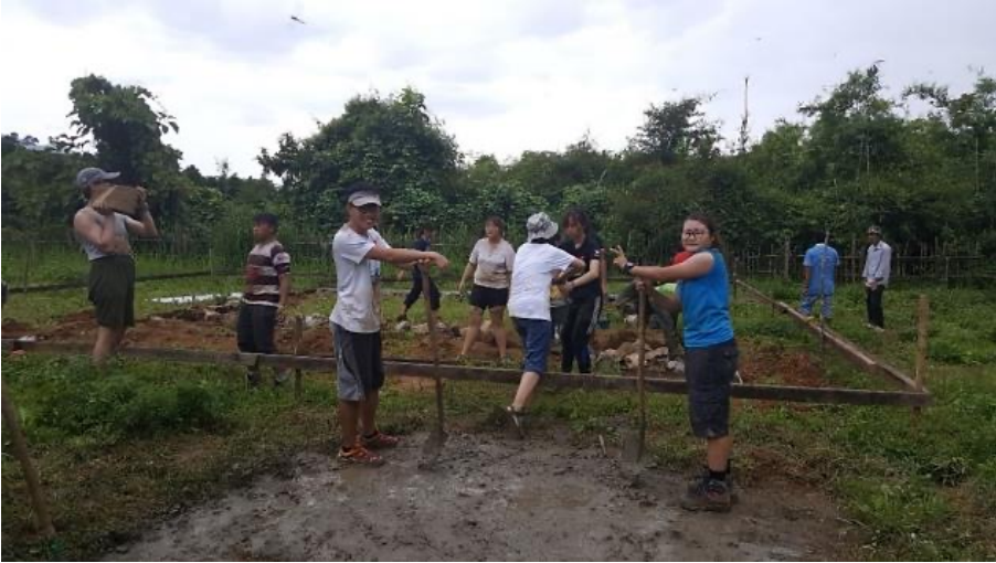
2014 Czech Republic Exchange Project