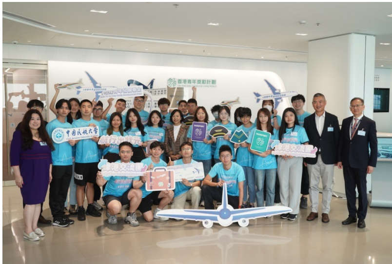
2023 Fly My Way Exchange Programme