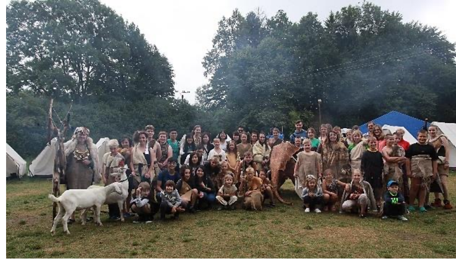
2016 Laos Service Project