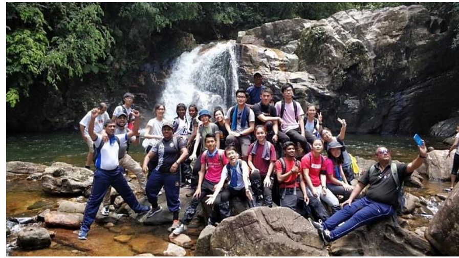
2019 Sri Lanka Exchange Project